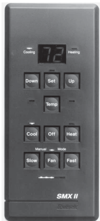
SMX II AB PXB styrplattaplatta visas